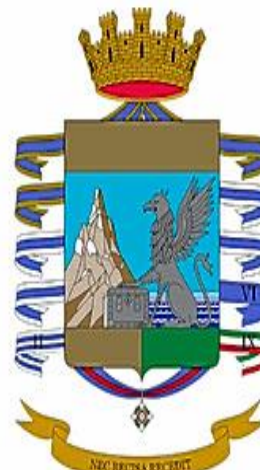
Guardia di Finanza