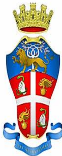
Arma dei Carabinieri Corpo Forestale (dal 2016 inglobato nei CC)