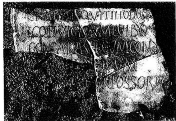
Fig. 4 Iscrizione dell'anno 380 con estratto di chirografo

Molto più che negli altri cimiteri romani la documentazione epigrafica della catacomba di Commodilla offre un quadro quanto mai esemplificativo in relazione alla presenza e al ruolo dei fossori tra la metà del IV sec. e l'inizio del V.