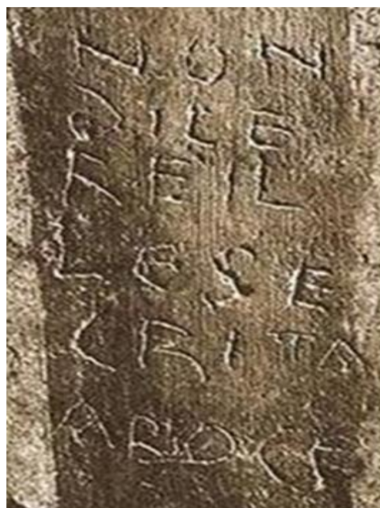
Fig. 8 Iscrizione di esortazione liturgica