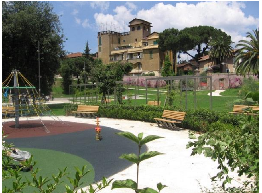
Parco delle catacombe di Commodilla

I due furono decapitati e sepolti in quello che ora è il Parco di via Giovannipoli, ma che precedentemente era proprietà di una certa Commodilla, dalla quale le catacombe presero il nome.