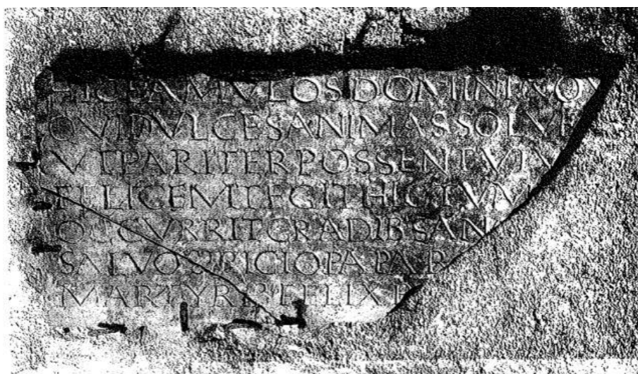
Fig. 2 Parte sinistra dell'epigramma siricano

Una seconda e autorevole testimonianza epigrafica è costituita da un epigramma del tempo di Papa Siricio, nel quale, dopo una prima parte in forma di elogium , si accenna – ma, obiettivamente, niente di più – ad un intervento, difficilmente ricostruibile nella sua articolazione realizzato da un Felice, presbitero del tempo di Papa Siricio.