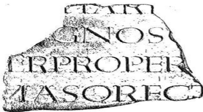
Fig. 1 Frammento dell'elogium di Papa Damaso in onore di Felice e Aduatto

L'«area sacra» della catacomba può senz'altro identificarsi nella galleria B della regione dell'arenario: è qui che all'epoca della persecuzione diocleziana furono deposte le spoglie di alcuni martiri e sicuramente quelle di Felice, Aduatto e Merita; quanto a Degna già il Delehaye giudicò retamente della sua inesistenza storica. E' in quest'area che Papa Damaso dispose l'allestimento di un piccolo organismo monumentale, i cui connotati però possono solo essere immaginati, ma un'ipotesi verosimile farebbe pensare ad una sorta di pseudociborio simili a quelli allestiti in Pretestato per San Gennaro e la coppia Felicissimo e Agapito.