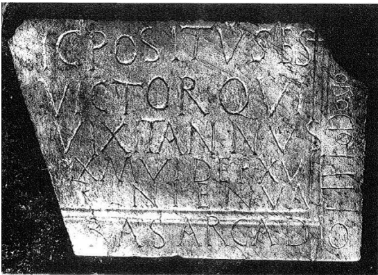
Fig. 3 Epitaffio di Victor dell'anno 402

Sono soprattutto le iscrizioni con la ricorrenza delle date consolari e, più in generale, con la presenza di talune specificità formulari e grafiche, che consentono di situare l'intero complesso cimiteriale di Commodilla entro coordinate cronologiche sufficientemente ben definite. Percentualmente molto numerose le iscrizioni con data consolare, delle quali la più antica è del 361, la più recente del 572: 36 appartengono alla seconda metà del IV sec., 30 al secolo V, 4 al secolo VI. In questo arco di tempo si situano coerentemente i caratteri prevalenti di una prassi formulare, che con ogni evidenza si configura come quella tipica della fase più tarda dell'epigrafia cimiteriale (metà IV-V sec.): le formule segniche locus del tale , hic iacet , hic quiescit , hic requiescit , le espressioni relative alla compravendita delle sepolture, la frequentissima ricorrenza dei monogrammi cristologici nella duplice forma del cristogramma e della croce monogrammatica, spesso accompagnati dalle lettere apocalittiche.