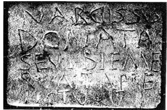
Fig. 6 Estratto di chirografo per l'acquisto di una sepoltura dal fossore Preiectus