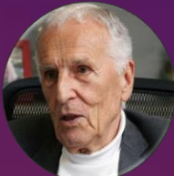
Prof. Silvio Garattini